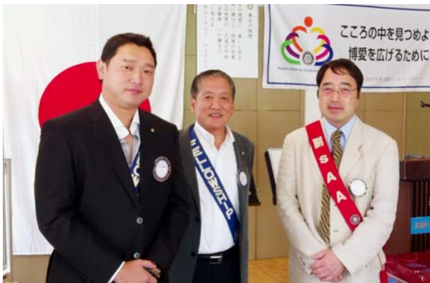
新規入会会員の入会式